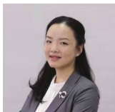
LI YI Αναπληρώτρια Καθηγήτρια Πανεπιστημίου Παραδοσιακής Ιατρικής της Σαγκάης Confucius Institute ΠαΔΑ