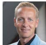
HOEGH MORTEN Αναπληρωτής Καθηγητής Πανεπιστημίου του AALBORG στη Δανία