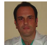
ΜΑΥΡΟΓΕΝΗΣ ΑΝΔΡΕΑΣ Αναπληρωτής Καθηγητής Ορθοπαιδικής ΕΚΠΑ