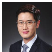
XU WENJIE Αναπληρωτής Καθηγητής Πανεπιστημίου Παραδοσιακής Ιατρικής της Σαγκάης, Διευθυντής του Confucius Institute ΠαΔΑ